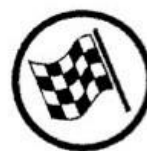
End of regularity test