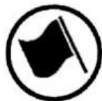
Regularity test start